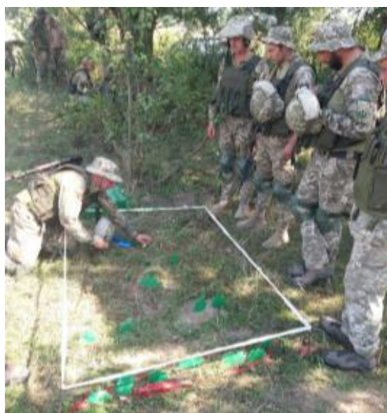
Рис. 6 – Определение ключевых мест.