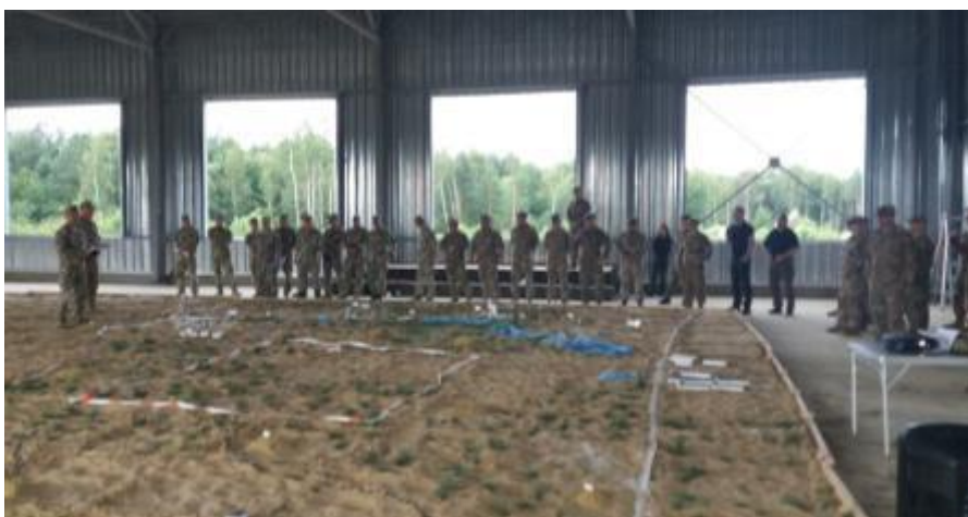
Рис. 1 – Проведение АПД с использованием макета местности.