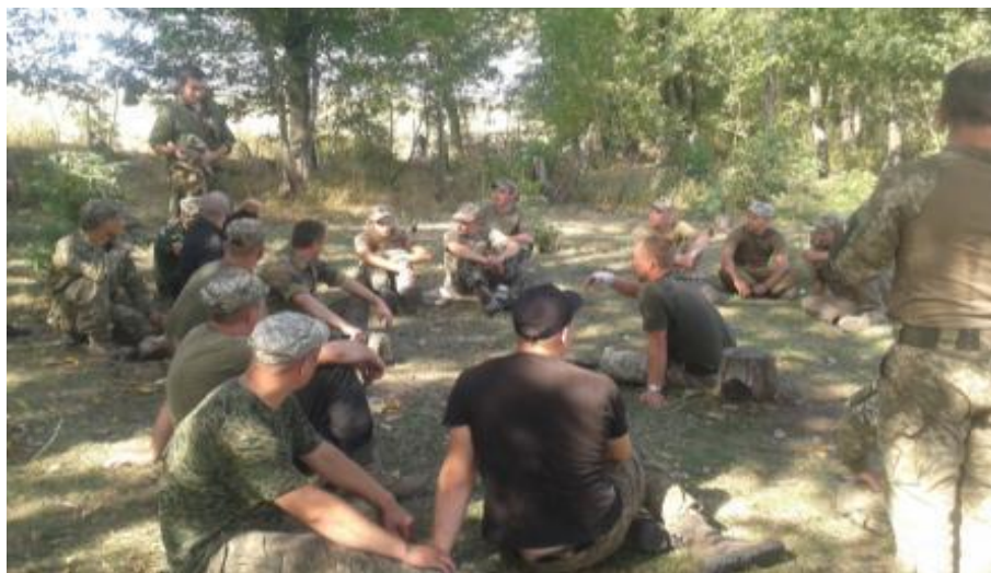
Рис. 4 – Проведение АПД в рабочем порядке (неформального) с использованием подручных средств.

После выполнения задачи «уничтожение противника на блокпосту при сближении с ним» командир взвода проводит АПД в рабочем порядке для того, чтобы исправить (скорректировать) и усилить сильные стороны при выполнении задачи. Используя простые подручные средства, такие как сосновые шишки или камни, для отображения личного состава взвода на местности командир взвода, командиры отделений и военнослужащие обсуждают ход выполнения задачи от начала до завершения (рисунок 4).