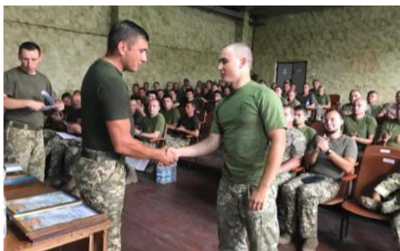
Рис. 8 – Поощрение личного состава, принимавшего участие в занятии, тренировке (учении).

Руководителем в конце АПД должно быть указано – на что в дальнейшем следует обратить внимание при организации подготовки и повседневной деятельности, порядок убытия в пункты постоянной дислокации (рисунок 8).