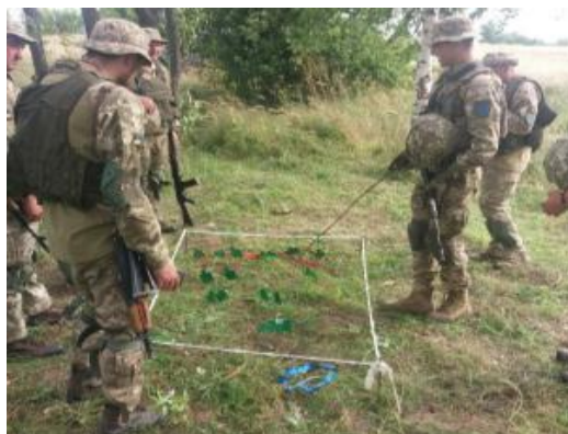
Рис. 7 – Проведение неформального АПД.

АПД в рабочем порядке (неформальный) – зачастую у командиров минимум времени для подготовки. При его наличии они определяют главные действия и замечания, на которые надо обратить внимание в первую очередь. Затем обобщают и анализируют все наблюдения, полученные лично и от подчиненных, для обсуждения с использованием одной из ранее представленных методик (рисунок 7).