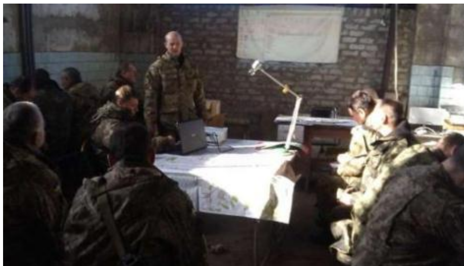
Рис. 3 – Проведение неформального АПД.

АПД в рабочем порядке требует меньше подготовки и планирования. Руководитель проводит АПД в рабочем порядке (рисунок 3) в заключительной части мероприятия подготовки (иногда, при необходимости, в ходе мероприятия подготовки), после предварительно оговоренных недостатков или с целью устранения недостатков на месте.