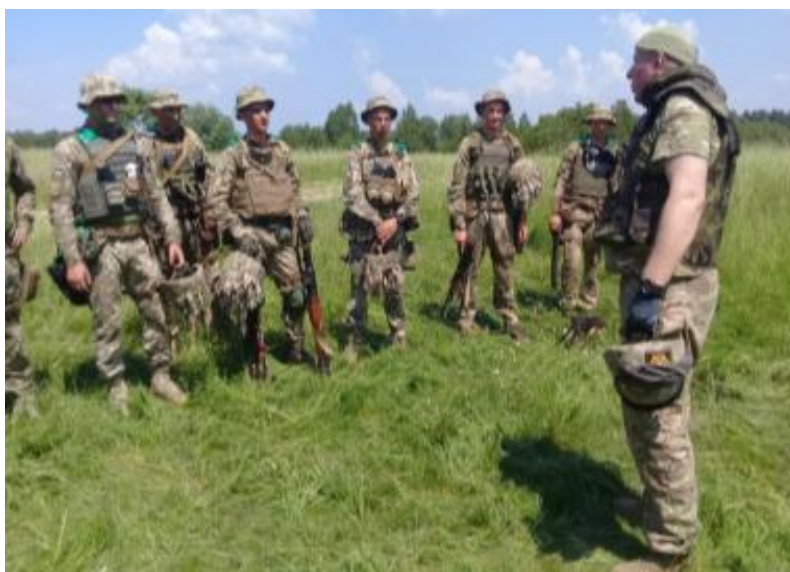
Рис. 5 – Подбор и подготовка оценщиков.

Внешних (независимых) оценщиков назначают из числа командиров, имеющих большой опыт и профессиональный уровень (рисунок 5).