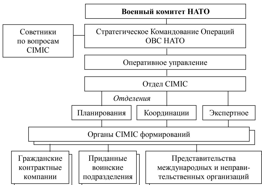
Рис. 2.2. Организационная структура органов военно-гражданского взаимодействия НАТО

Военно-гражданские взаимоотношения (ГВО) (рис. 2.2) в общем плане могут быть определены как совокупность отношений, возникающих между военными институтами, с одной стороны, и гражданским правительством, неправительственными институтами, организациями и гражданами – с другой. Эти отношения базируются на широком спектре как формальных, так и неформальных взаимодействий. Формальные отношения регулирует законодательство, прежде всего конституция страны. Неформальные отношения представляют временные (от ситуативных к долговременным) альянсы и связи наподобие военно-политических, военно-промышленных, военно-образовательных, военно-культурных и тому подобное. На неформальные отношения особенно влияют национальные традиции коммуникаций между разными социальными группами, особенности восприятия военными гражданских сограждан, а гражданскими – военных.