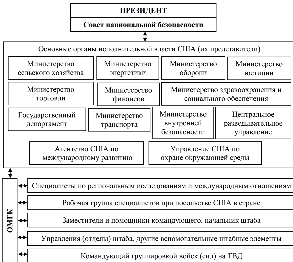
Рис. 2.1. Структура органов исполнительной власти США, принимающих участие в оперативном планировании информационных действий

Важно также отметить, что в целях повышения эффективности таких мероприятий в условиях будущих информационных операций особое внимание следует обращать на более качественную разработку документов оперативного планирования информационных действий вооруженных сил.