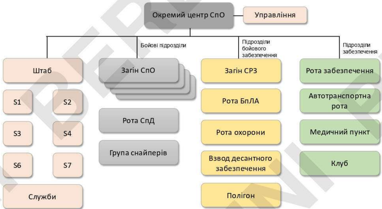
Рисунок 3 – типова організаційна структура оц СпО (СпП).

2.3.2. Для проведення операцій (дій) на морі (воді) може створюватися морський компонент, який, як правило, може включати підрозділи ССпО ЗС України для дій на морі (воді) та плавзасоби.