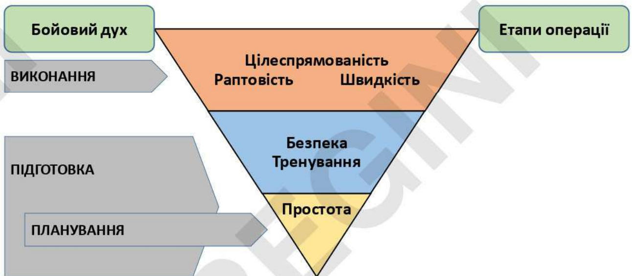
Рисунок 1 - умови (вимоги) підготовки та проведення спеціальної операції (дій).

Схематично саму суть СпО (СпД) зображено на рисунку 1. Де трикутник (СпО (СпД)) буде стійким за умови його рівномірного наповнення та підтримки його бойовим духом особового складу та відповідності їх дій до обстановки, що склалась.