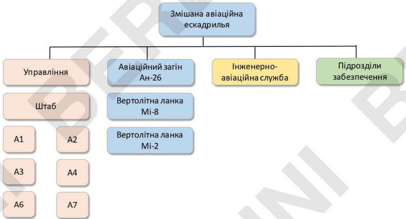
Рисунок 7 – типова організаційна структура повітряного компоненту ССпО ЗС України.