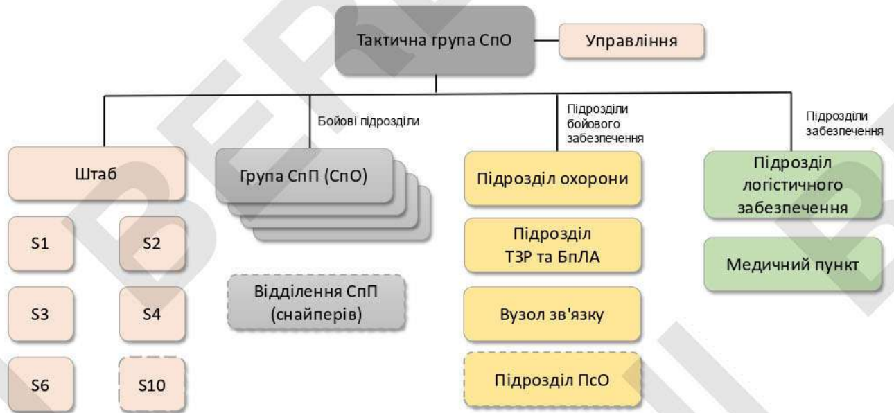
Рисунок 5 – типова організаційна структура ТГр СпО.