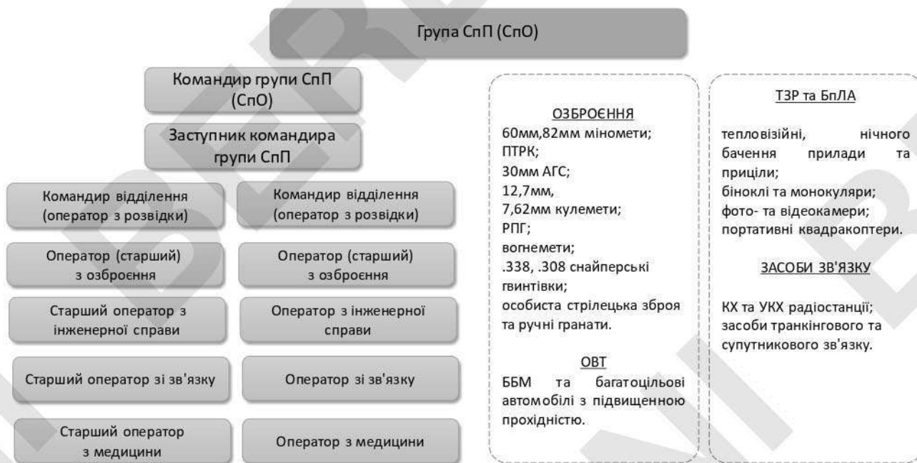
Рисунок 6 – типова організаційна структура групи СпП (СпО).

2.5.3. Озброєння та військова техніка, спорядження та інші матеріальні засоби (ресурси) групи СпП (СпО) визначаються відповідно до визначених завдань, умов обстановки, характеру об'єкта, місцевості тощо.