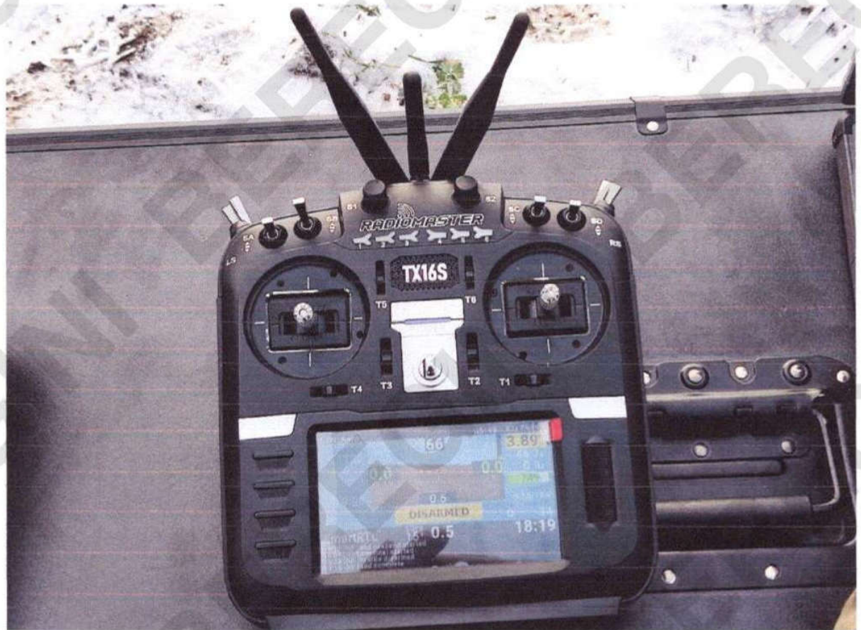
Рисунок 8 – Пульт керування БПЛА