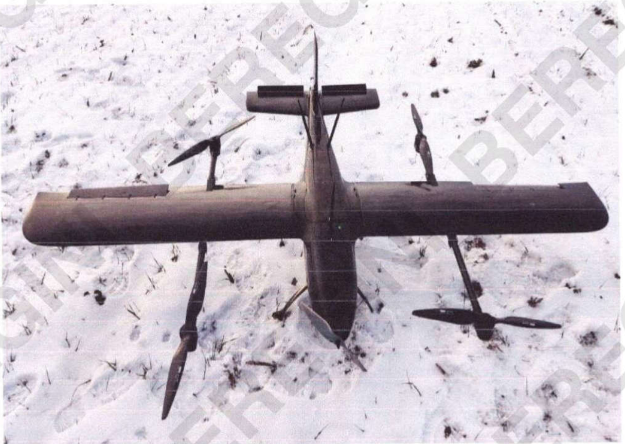
Рисунок 2 – Вид БПЛА “Гермес-20” з переду