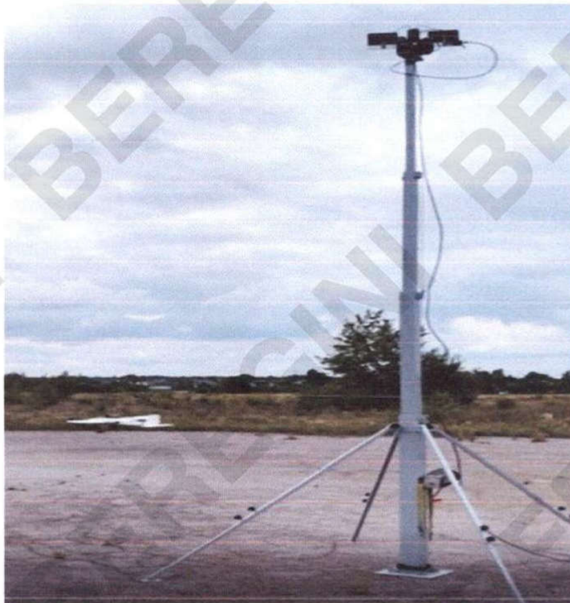
Рисунок 18 – Автоматична система супроводження антен з системою зв'язку