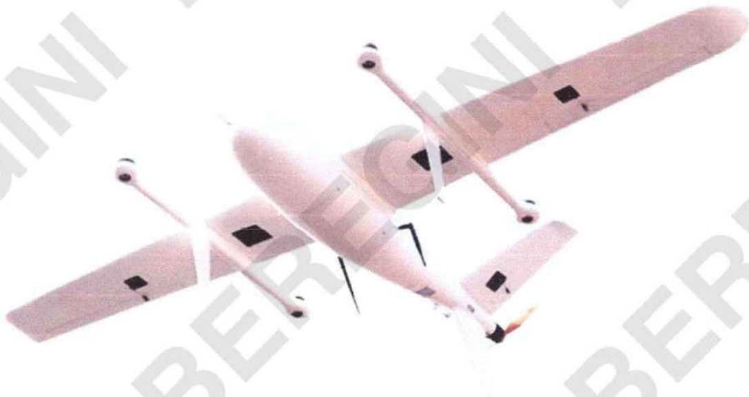
Рисунок 4 – Загальний вигляд БпЛА “Бджола – 20К” (вид знизу)

В конструкції планера БпЛА “Гермес-20” та “Бджола-20К” є невеликі відмінності, а саме: