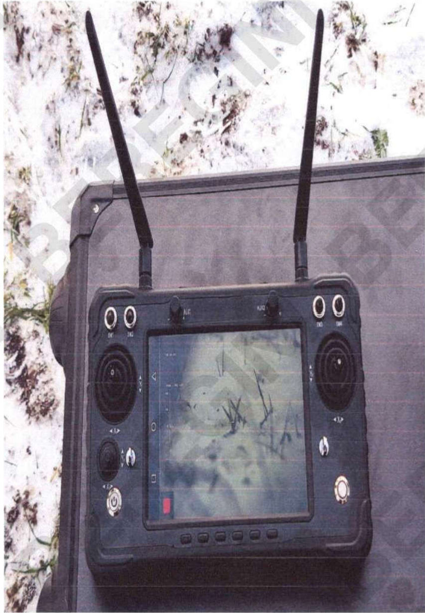
Рисунок 9 – Пульт керування гіростабілізованою платформою БПЛА