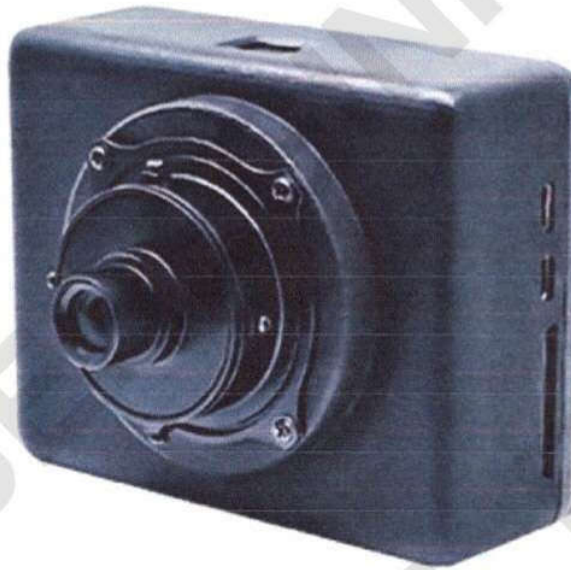
Рисунок 14 – Картографічна камера MAP-A7RIV

Канал керування БпЛА – захищений цифровий канал, що працює на частоті 902-928 МГц з технологією псевдовипадкової перебудови робочої частоти, з швидкістю передачі даних до 276 кбіт/с. Забезпечує дальність зв'язку до 50 км.