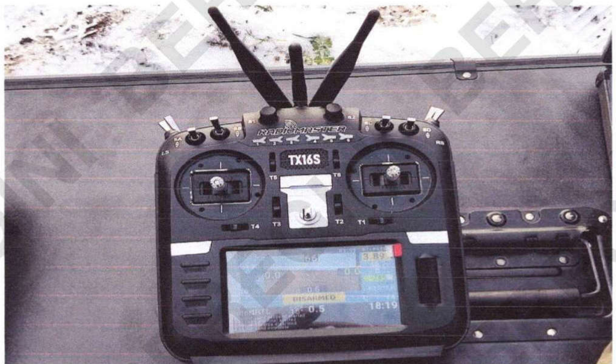
Рисунок 16 – Пульт керування БпЛА