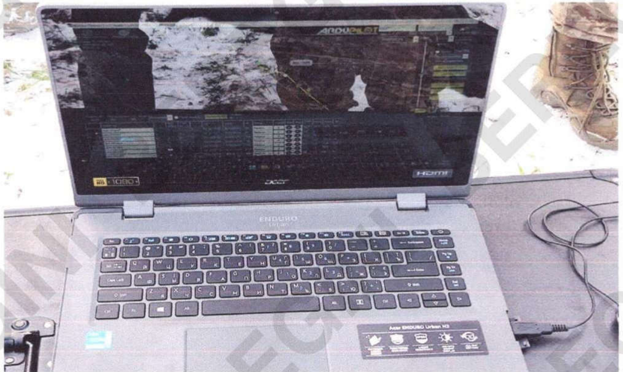
Рисунок 15 – Ноутбук керування БпЛА

пульт керування гіростабілізованою платформою БпЛА (рисунок 17); автоматична система супроводження антен з системою зв'язку (рисунок 18).