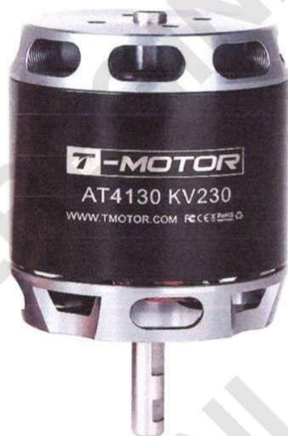
Рисунок 10 – Трифазний асинхронний електричний двигун БпЛА “Бджола - 20К”

Опис системи VTOL (системи вертикального зльоту та посадки) БпЛА “Бджола - 20К”.