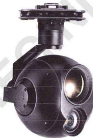
Рисунок 12 – Гіростабілізована платформа з камерою видимого спектрального діапазону та інфрачервоного спектрального діапазону Q30TIR-50