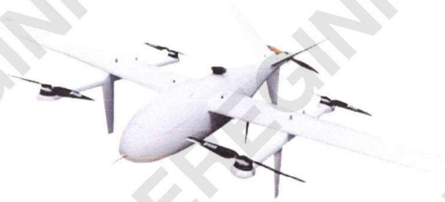
Рисунок 3 – Загальний вигляд БпЛА “Бджола-20К”