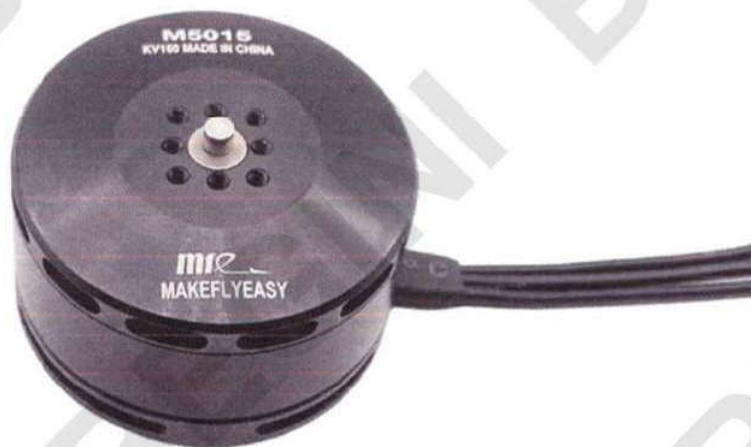
Рисунок 5 – Асинхронний двигун системи VTOL БпЛА “Гермес-20”

чотири 20-дюймові гвинти з вуглецевого волокна.