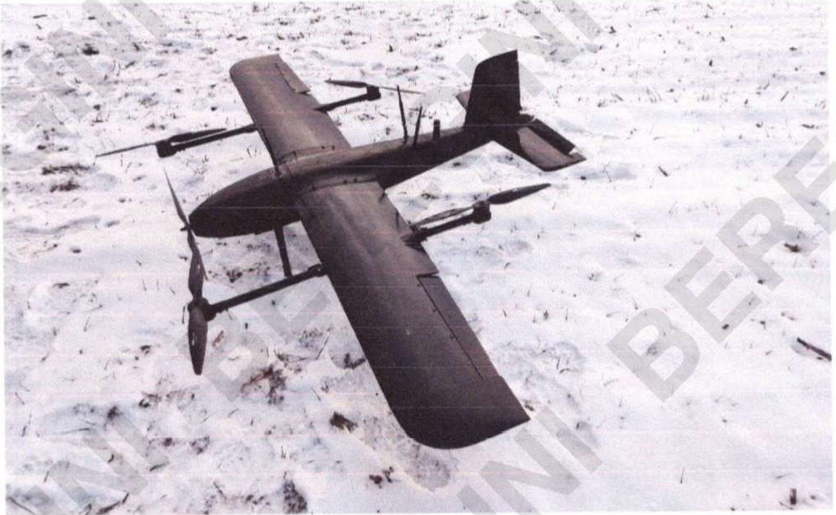
Рисунок 1 – Загальний вигляд БПЛА “Гермес-20”