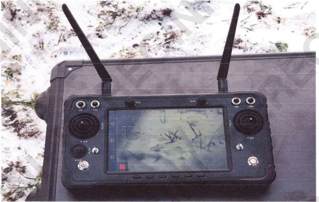
Рисунок 17 – Пульти керування гіростабілізованою платформою БПЛА