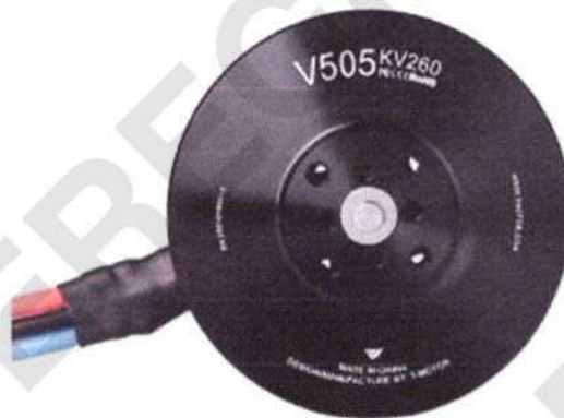
Рисунок 11 – Асинхронний двигун системи VTOL БПЛА “Бджола - 20К”

чотири електронні регулятори швидкості (ESC) на 240 А; чотири 17-дюймові гвинти з вуглецевого волокна.