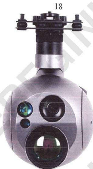
Рисунок 13 – Гіростабілізована платформа з камерою видимого спектрального діапазону, камерою інфрачервоного спектрального діапазону та лазерним далекоміром А30TR-50