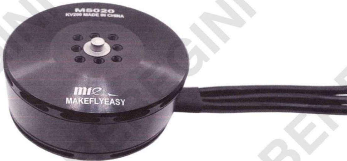
Рисунок 5 – Трифазний асинхронний електричний двигун

Основні тактико-технічні характеристики трифазного асинхронного електричного двигуна БпЛА наведені в таблиці 2.