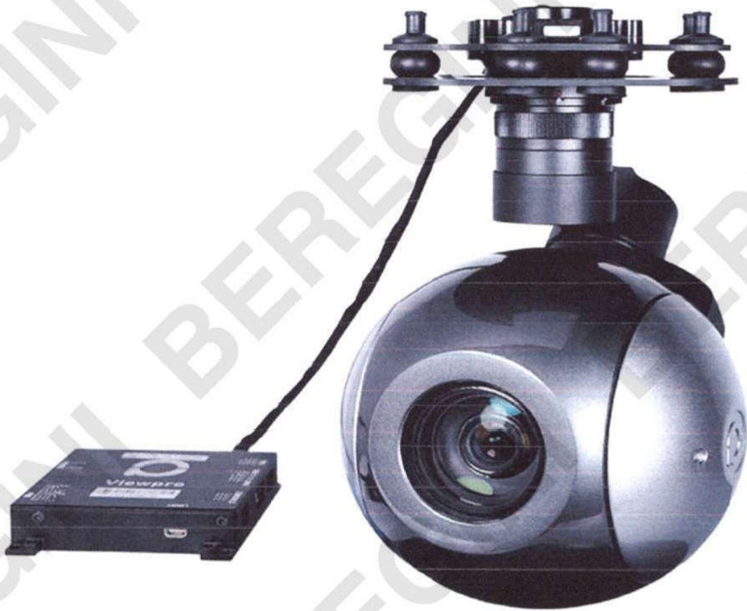
Рисунок 6 – Гіростабілізована платформа з камерою видимого спектрального діапазону Q40T