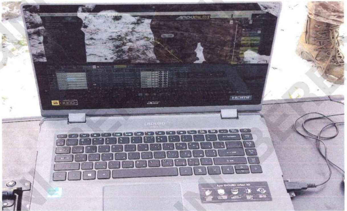
Рисунок 7 – Ноутбук керування БПЛА